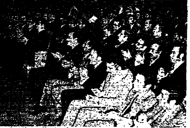
في مهرجان دمشق مساء أمس، يرفع الرئيس الأسد والجيش والشرطة العلم السوري، ويؤدى النشيد القومي، ويحضره وزير الخارجية السوري ووفد الخديف

وقد جندت الجماهير في هذه الذكرى الحبيبة للمهد على مواصلة النضال من أجل التحرير وبناء المجتمع العربي الاشتراكي الموحد.